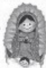
Virgen y niño periblanco

Para más información llame (512) 269-7909 o (254) 627-9362.